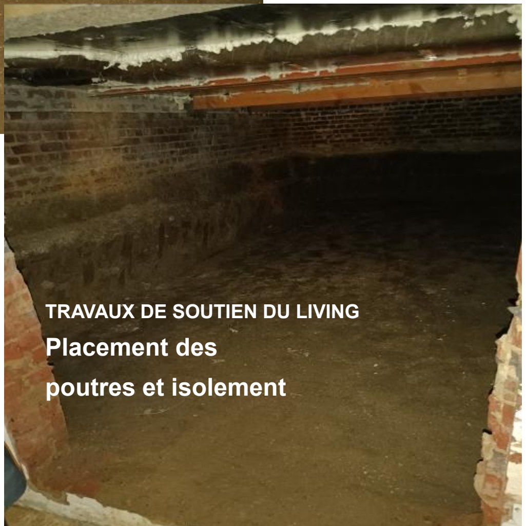
TRAVAUX DE SOUTIEN DU LIVING Placement des poutres et isolement