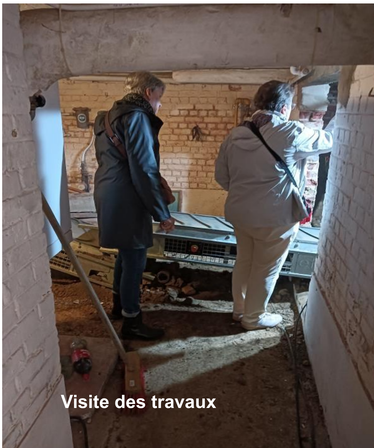
Visite des travaux