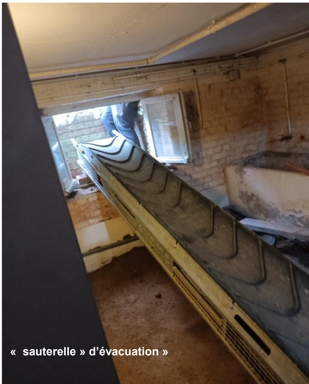
« sauterelle » d'évacuation »