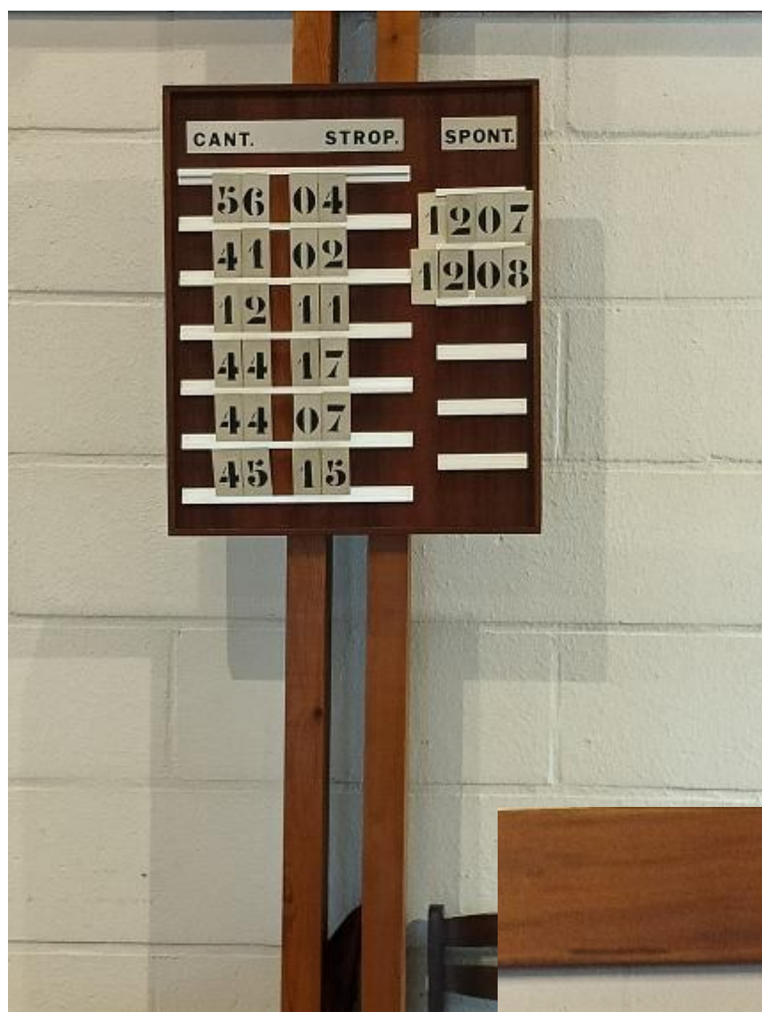
Réinstallation des panneaux d'annonces des cantiques et des lectures bibliques